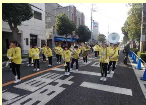
金管バンドクラブ 義士祭パレード